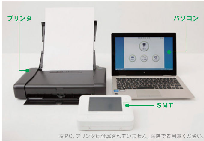
※ PC、プリンタは付属されていません。医院でご用意ください。

SMTは測定機器をPC・プリンタと接続して測定します。PCの対応OSはWindows7～/Mac OS X 10.10～です(最新OSの対応状況についてはお問合せ下さい)。また、PCにはUSB端子(Type-A2.0以上)が必要です。iPad、Android、Chromebook等ではお使いいただけません。