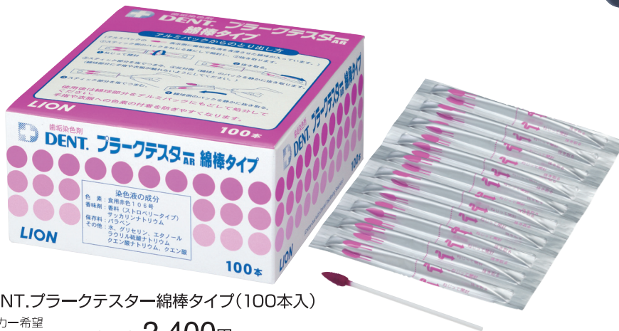
DENT.プラークテスター綿棒タイプ(100本入)