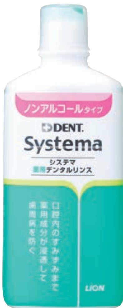
ノンアルコールタイプ (450ml)