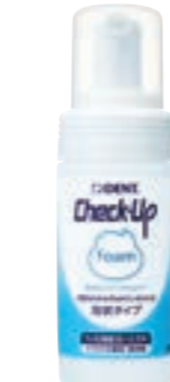
フッ化ナトリウム950ppmF