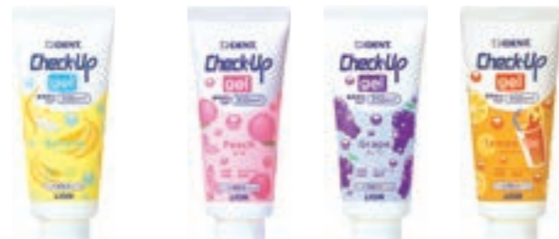
バナナ ピーチ グレープ レモンティー フッ化ナトリウム500ppmF フッ化ナトリウム950ppmF