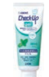
フッ化ナトリウム 1450ppmF 殺菌成分CPC ® 配合 ※塩化セチルピリジニウム