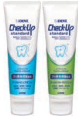
マイルドビュアミント マイルドシトラスミント フッ化ナトリウム 1450ppmF

P.33 Check-Up kodomo Check-Up kodomo 500 医薬部外品