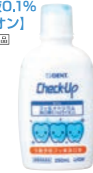
フッ化ナトリウム450ppmF 毎日の洗口に適しています。