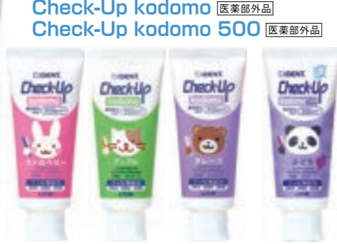
ストロベリー アップル グレープ ぶどう マイルドミント フッ化ナトリウム950ppmF フッ化ナトリウム500ppmF フッ化ナトリウム 1450ppmF