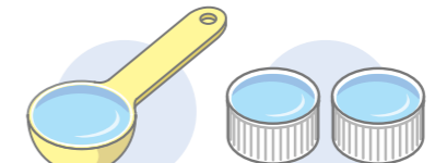
大きじ1杯分 ペットボトルキャップ 約2杯分