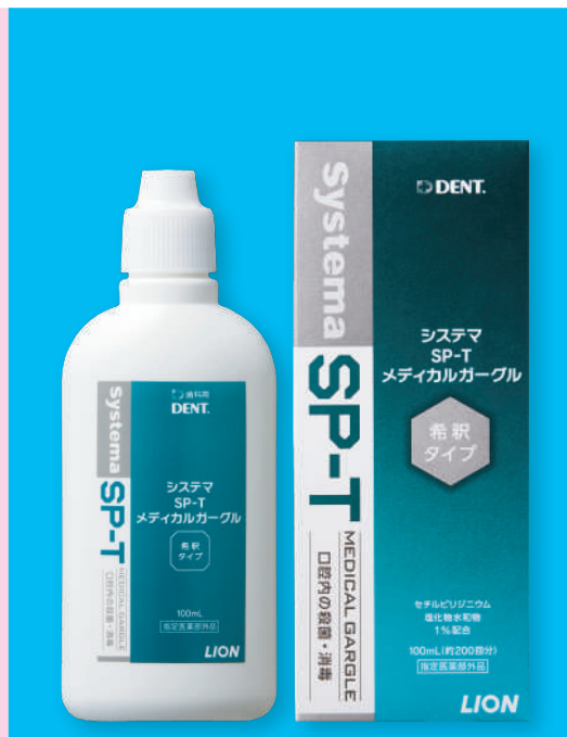
Systema SP-T メディカルガーグル 指定医薬部外品 1箱(6個)