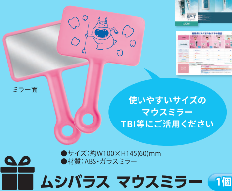
使いやすいサイズのマウスミラー TBI等にご活用ください ●サイズ:約W100×H145(60mm) ●材質:ABS・ガラスミラー ムシバラス マウスミラー 1個