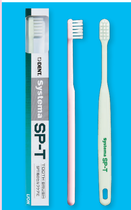
Systema SP-T 歯ブラシ 1箱(12個)